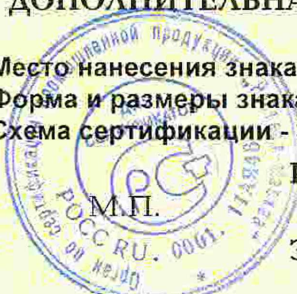
Схема сертификации - 3.

Место нанесения знака соответствия - на товарном ярлыке, рядом с товарным знаком изготовителя. Форма и размеры знака по ГОСТ Р 50460-92.