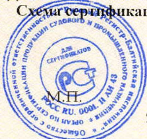
Схема сертификации 3.