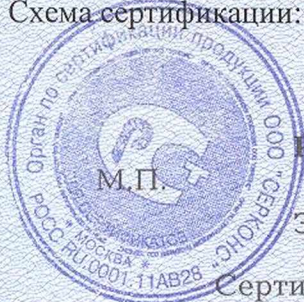
Схема сертификации: 2.